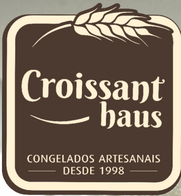
Tabela de Produtos